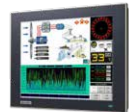
11. HMI Touchpaneler