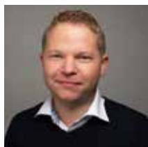
ANDREAS J FRIBERG

Touchpanelerna finns i två modellserier där WebOP-2000 serien har ett Real time operating system (RTOS) som operativsystem och WebOP-3000 serien som har WinCE 6.0 som operativsystem.