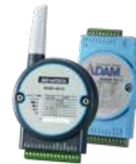
10. I/O moduler