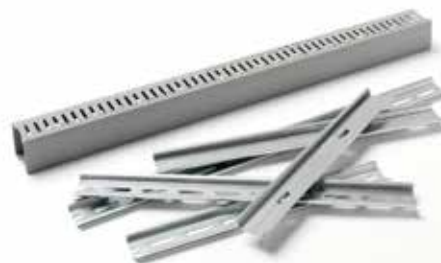
Kapning av DIN-skenor och kabelkanaler