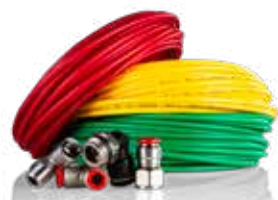
20. Slang & Kopplingar