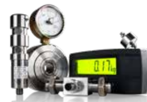
24. Lastceller & Kraftgivare