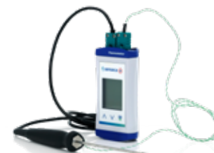
34. Handhållna instrument