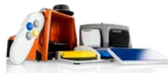
32. Fotpedaler Herga